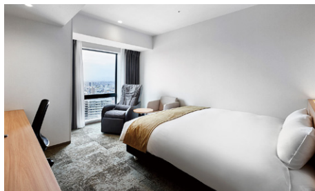
デラックスクイーン (25.2m 2 )