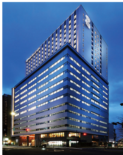
ダイワロイネットホテル大宮西口