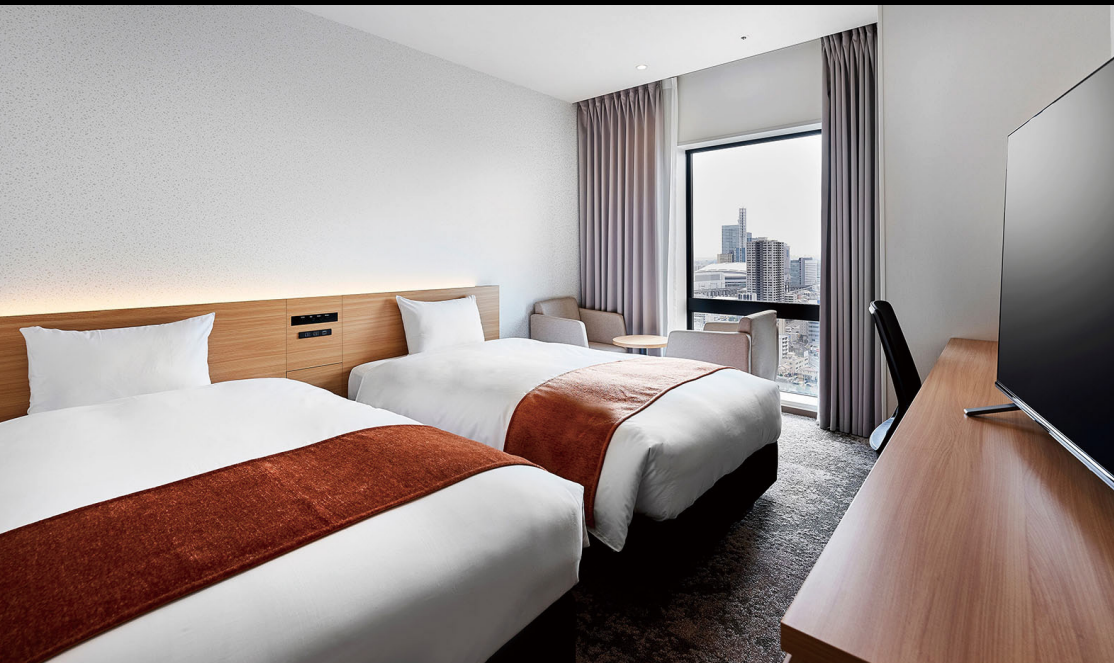
モデレートツイン (25.8m 2 )