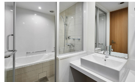
セパレートタイプのバスルーム (一例)

ユニバーサルダブルを除く全室バス・トイレ別のセパレートタイプで、ゆったりとしたバスタイムをお楽しみいただけます。複数名でのご宿泊時も、気兼ねなくご利用いただけます。