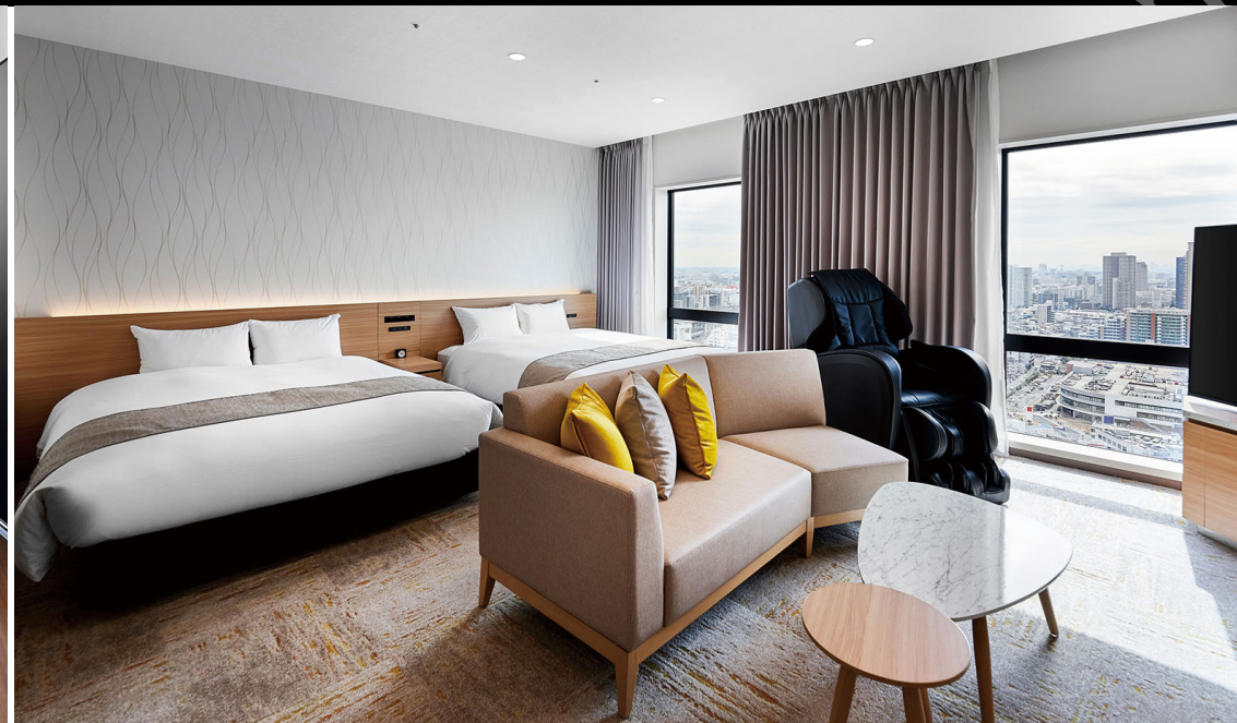
ジュニアスイート (46.1m 2 )